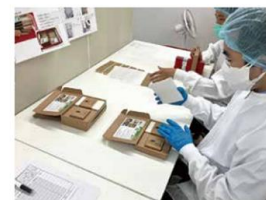
(左から) せっけんの天面、シートを敷いた型に原料を流し込む工程、エコマーク、梱包作業の様子