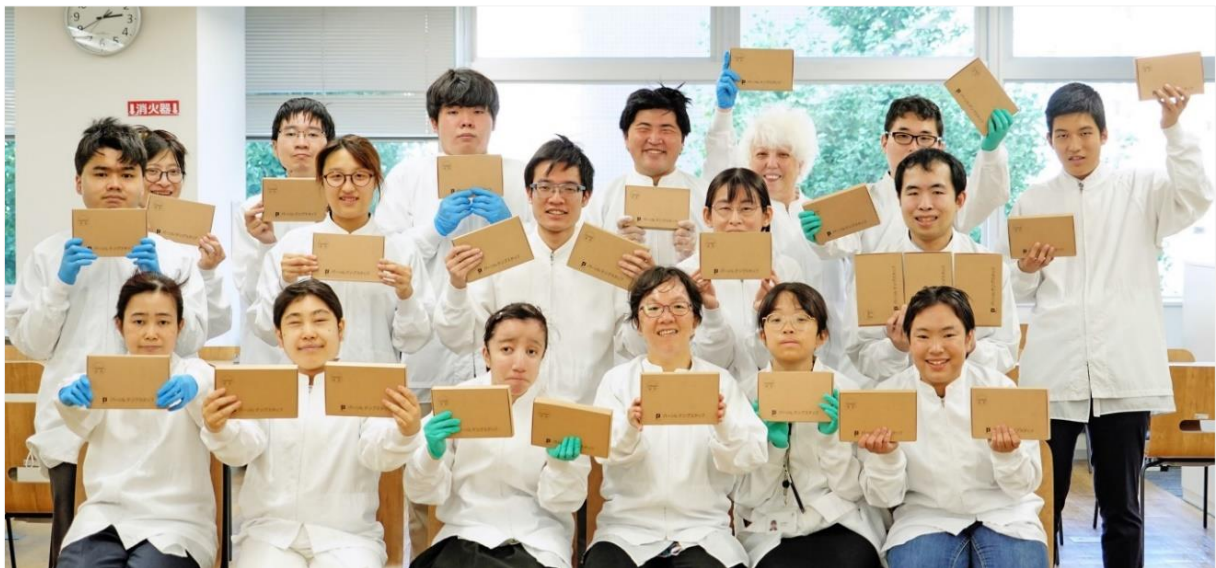
とみおかシルクを使用した『ハンカチタオルとせっけん』を持つ「パーソルダイバース」ではたらく社員のみなさん

昨年度の記念品に対するスタッフアンケートを参考に、環境に配慮した製造工程の改善を行い、せっけんの破片約180キロ（せっけん約3,000個分）の廃棄を削減し、包装資材も昨年比約7,800キロの削減を実現しました。